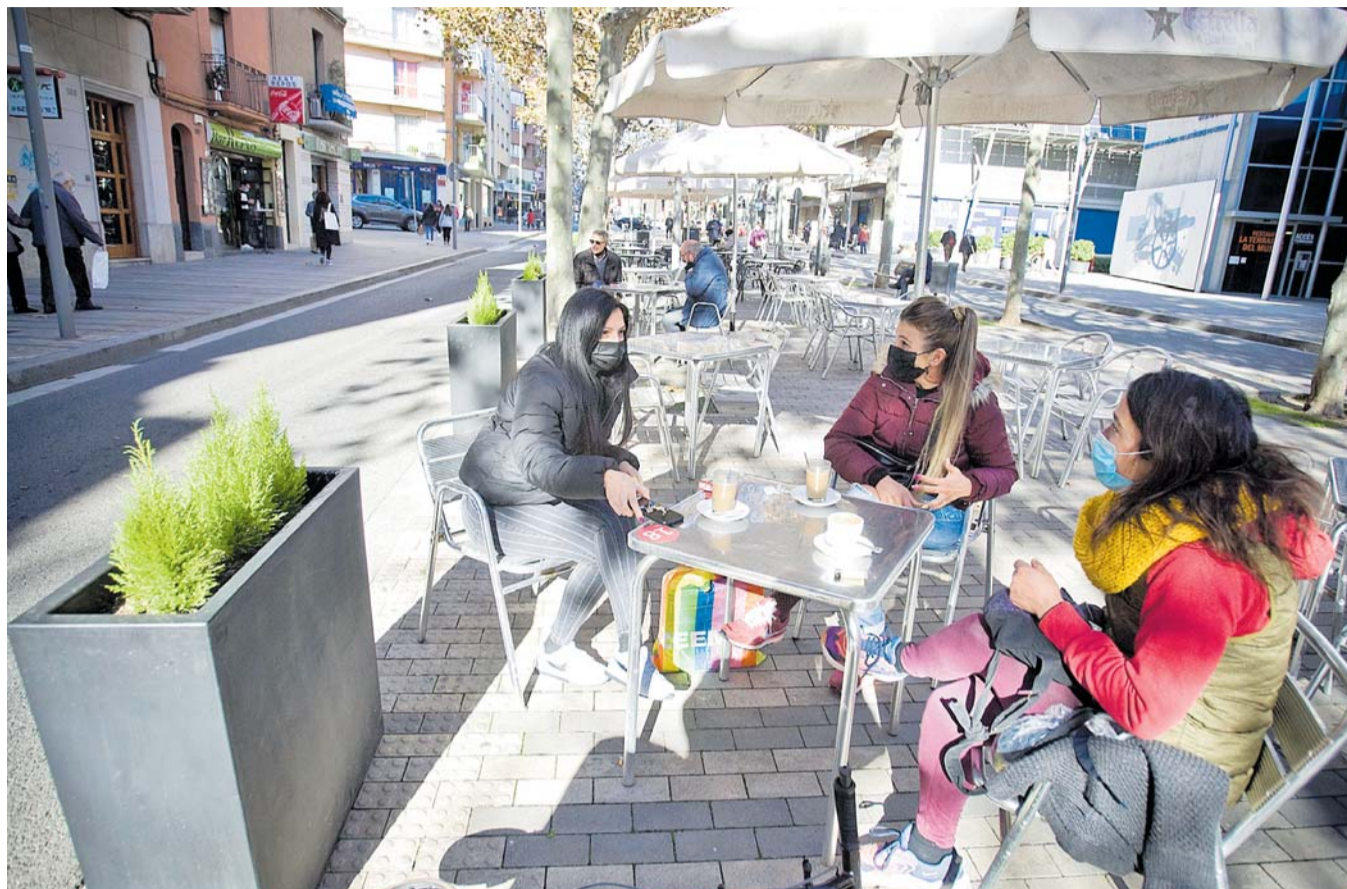
Unes noies consumint ahir a la terrassa d'un bar de la Rambla d'Ègara. NEBRIDI ARÓZTEGUI