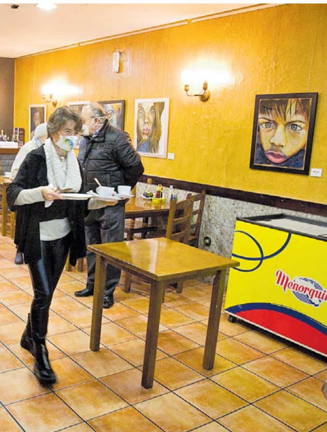
Sant Pau, al Centre de Terrassa.