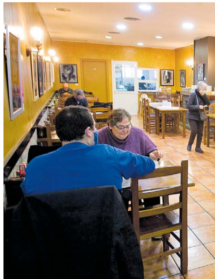
Clients a l'interior del restaurant Cal Felip, situat al carrer de...