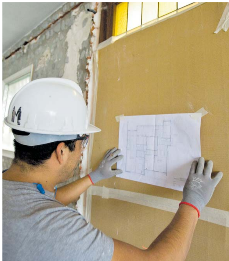
A Catalunya hi ha prop de cinc-cents mil autònoms.

I abunda: "Mentre l'empresa pot acollir-se a ERTOS per causes objectives o econòmiques sense límits, l'autònom ha d'arribar a una situació extrema, al punt de la misèria, per poder acollir-se a una prestació de cessament o a la re-