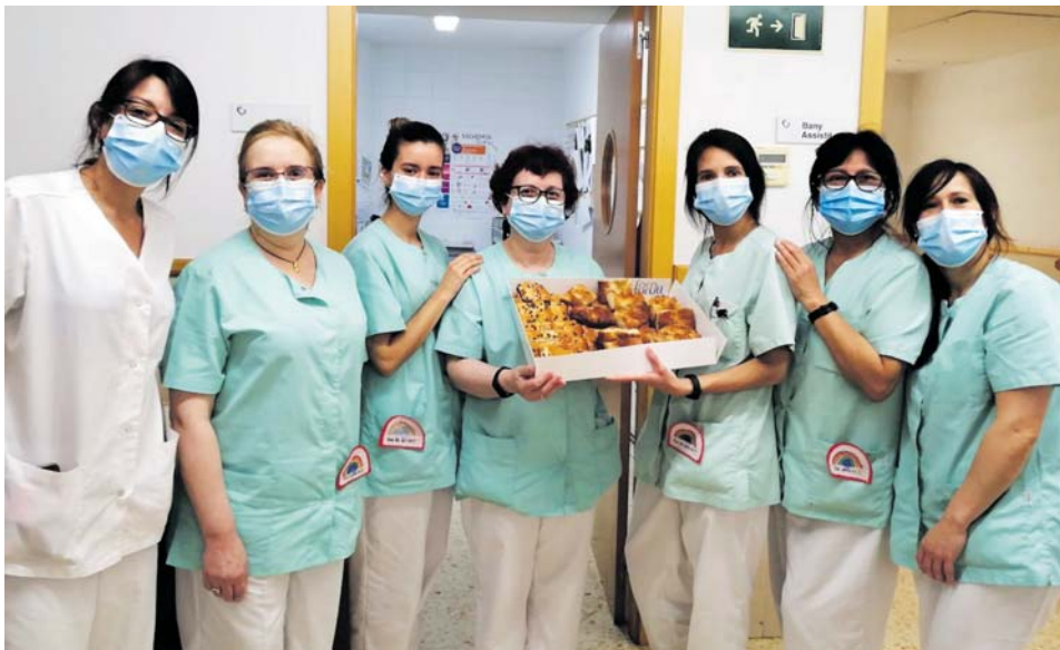
Un esmorzar per agrair la tasca dels professionals que treballen a residències.