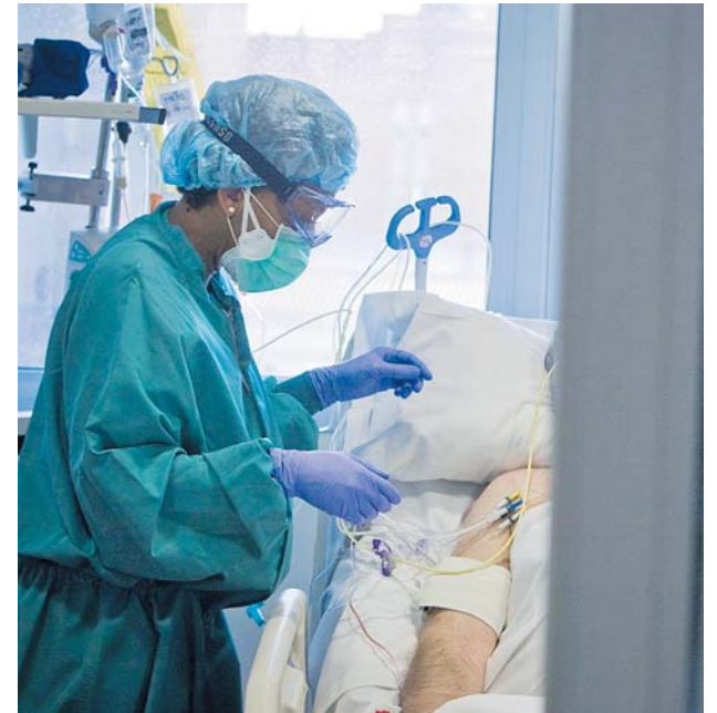
Les companyies recollen fons per l'assaig #JoEmcorono.

Els usuaris de Viladecavalls, Ullastrell, Rellinars i les urbanitzacions de Vacarisses que vulguin passar-se a la factura digital poden fer-ho des de la web www.minaserveisdai-gua.com i els de Matadepera